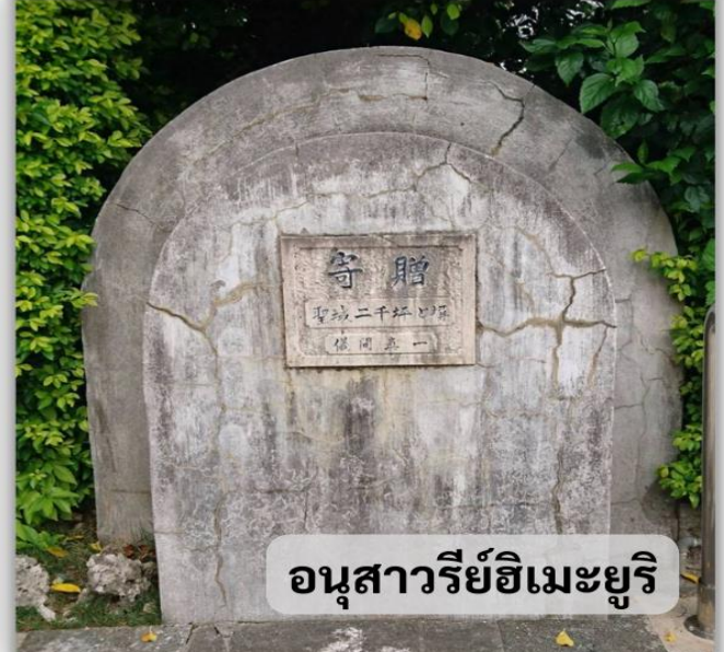
อนุสาวรีย์ฮิเมะยูริ

อนุสาวรีย์ฮิเมะยูริ ที่สร้างขึ้นเพื่อรำลึกถึงดวงวิญญาณของเหล่านักเรียนหญิงฮิเมะยูริที่ได้เสียชีวิตในสงครามโอกินาว่าในปี 1945 และปี 1989 โดยนักเรียนฮิเมะยูริคือนักเรียนหญิงมัธยมปลายและครูที่ได้เข้าไปมีส่วนร่วมในสงครามโอกินาว่าเพื่อดูแลผู้ป่วยขนาน้ำและอาหารให้กับกองทัพก่อนที่จะเสียชีวิตลงจากลูกหลงของการสู้รบที่รุนแรงขึ้น