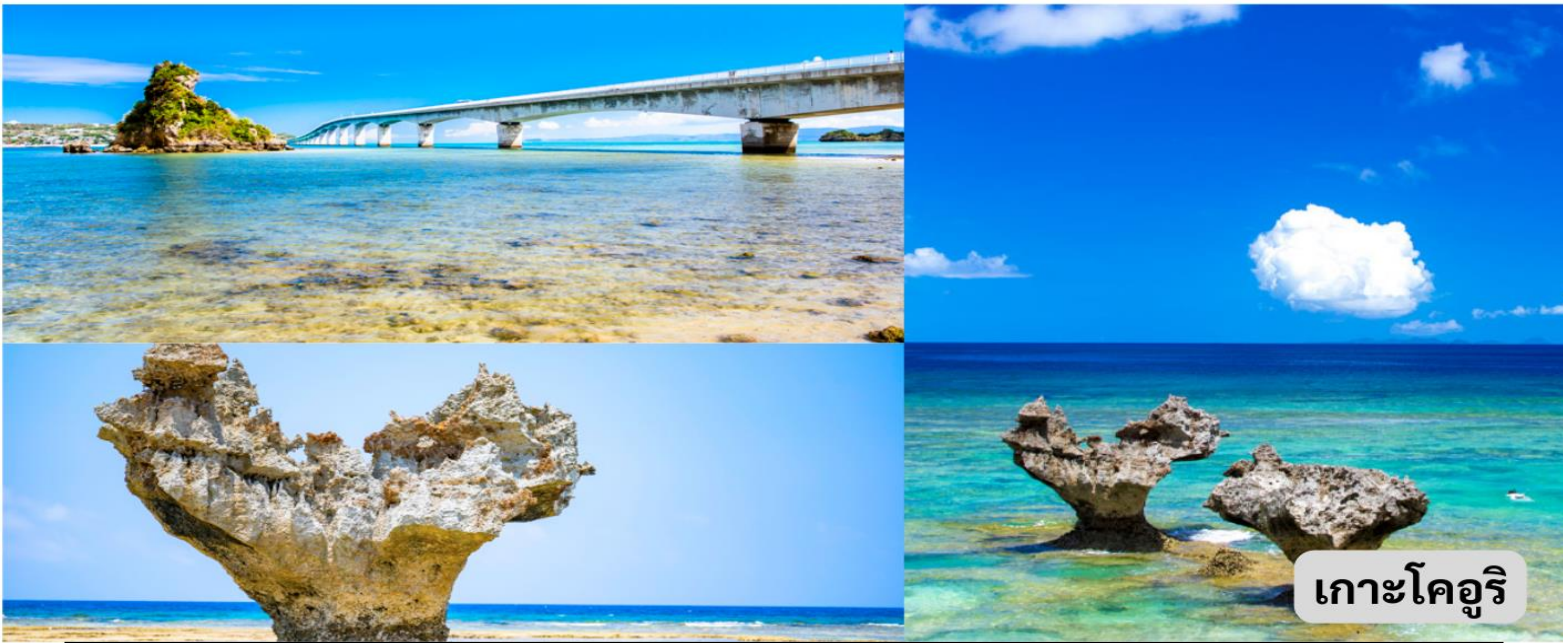
เกาะโคอูริ

สวนสับปะรดนาโกะ เก็บเกี่ยวประสบการณ์ท่องเที่ยวที่สนุกสนานและเต็มไปด้วยความรู้เกี่ยวกับ สับปะรด และนั่งรถชมทุ่งสับปะรด ภายในสวนจำหน่ายของที่ระลึก ผลิตภัณฑ์ต่างๆที่ผลิตจาก สับปะรด เช่น ไวน์ น้ำผลไม้ เค้ก ช็อคโกแลต สับปะรดอบแห้ง และสับปะรดสด นอกจากนี้ยังสามารถชมวิธีการปลูกสับปะรดเพื่อบรรจุกระป๋อง